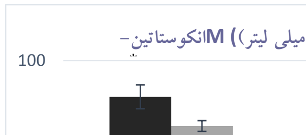
نمودار ۳: سطوح انکوستاتین-M بافت تومور و عضله دوقلو